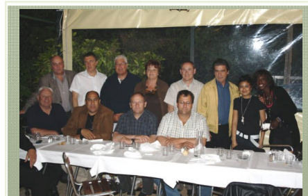
CD APC : séquence préparation AG 2010