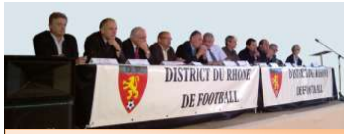
AG d'été du District de football du Rhône 18 juin 2010

Samedi 19 juin 2010, 06h00. Le réveil sonne. On aurait aimé avoir une heure de sommeil de plus mais tout le monde est attendu à Saint Romain de Popey pour préparer la salle. Les présidents des clubs sont attendus à partir de 9h00 et tout doit être prêt : liste d'émargement, enveloppes et bulletins de vote, PV de l'AG d'été à distribuer au cas où un président l'aurait oublié